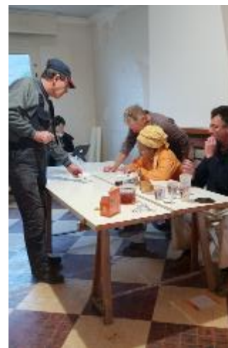
A la pause (indispensable !) les discussions techniques vont bon train !