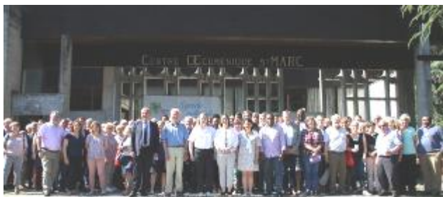
Les délégués au synode national sur le parvis de Saint-Marc le 31 mai 2019