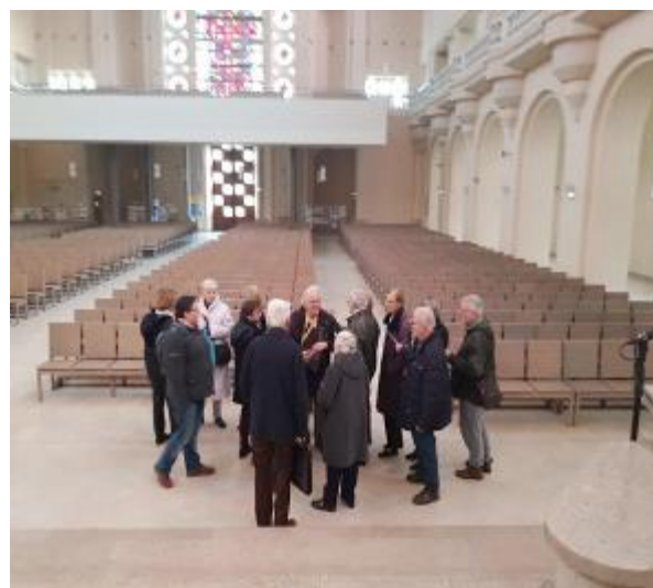
Le groupe dans la basilique... qui peut accueillir 1500 personnes (avec les loggias et la tribune moderne) !

NB : Pour ceux qui voudraient en savoir plus, lire : Patrick Gaso et Gilles-Marie Moreau, La Basilique du Sacré-Coeur de Grenoble , éd. L'Harmattan, en vente à la basilique.