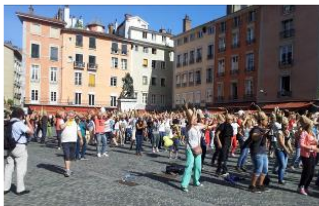
Le « flash mob » du Grand Kiff, place Saint-André à Grenoble le 29 juillet 2013.

L'EPUdG s'est aussi lancée avec détermination dans la démarche nationale « Église verte », où elle a déjà le niveau Cep de vigne et travaille pour atteindre le label Figuier !